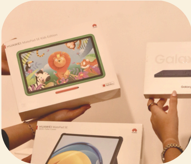
رحلة نحو العلم