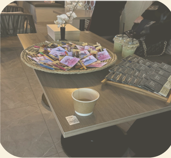
ابطال الصحة الصغار